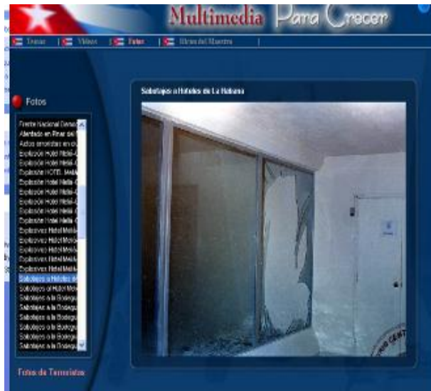
Fig 2. Activado módulo Fotos

Ejemplo del desarrollo de una preparación política e ideológica a los docentes del Dpto. TIC