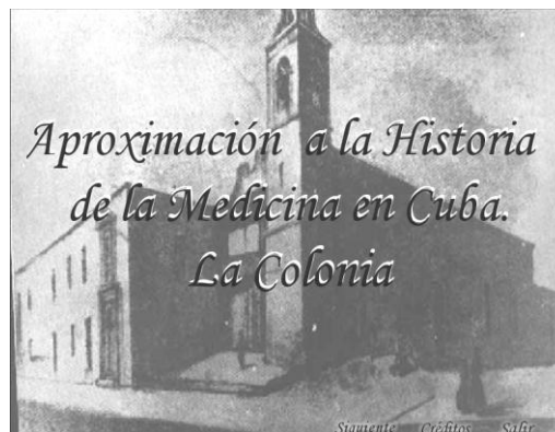
Figura. 1: Pantalla de Presentación

Cuando se ordena la ejecución del programa, se muestra la pantalla de bienvenida, que visualiza el título de la multimedia: Aproximación a la Historia de la Medicina en Cuba. La Colonia, con una imagen de fondo del Hospital de San Felipe y Santiago, donde se impartió docencia médica por primera vez en Cuba por parte de los Hermanos de la orden religiosa San Juan de Dios, y en la parte inferior los botones Siguiente, Créditos y Salir, tal como se muestra en la Figura 1.