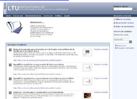
Figura 2: Implementación y adaptación de un CWIS como RREA